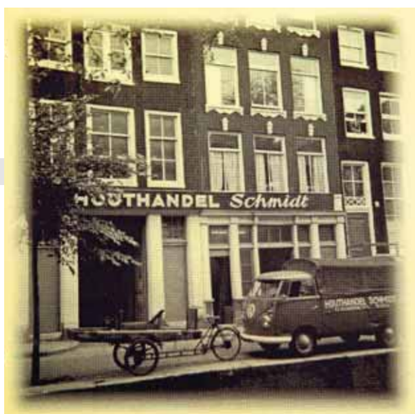
• De Oudezijds Achterburgwal was vroeger een gunstige locatie voor een 'bouwmarkt'.